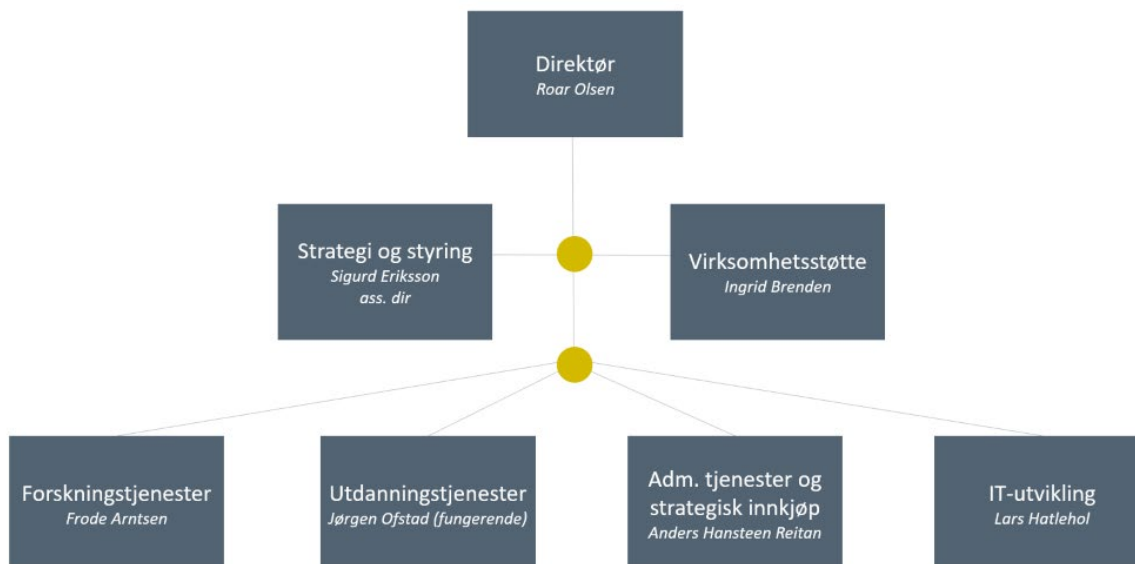
Figur 1: Organisasjonskart

Units organisasjonsmodell er en kombinasjon av en tradisjonell linjeorganisasjon som skal sikre fagansvar og brukerdiallog med forsknings-, utdannings- og administrative miljøer og en matriseorganisasjon som skal sikre effektiv bruk av IT- utviklere. Unit har to avdelinger som har tverrgående ansvar, strategi og styring som sikrer overordnet strategisk styring og virksomhetsstøtte som leverer tjenester til hele organisasjonen.